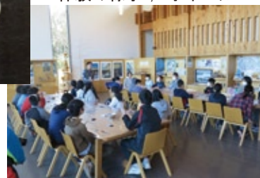
体験の様子 / 小ホール