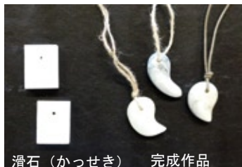
滑石（かっせき） 完成作品