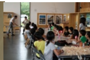
体験の様子 / 小ホール