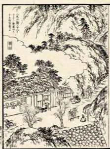
西国三十三所名所図会