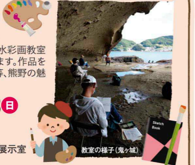
教室の様子(鬼ヶ城)