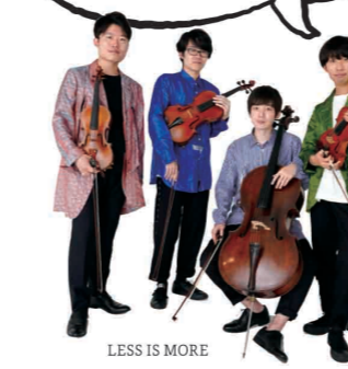
LESS IS MORE