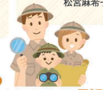
曾根次郎坂・太郎坂

熊野古道や周辺地域の歴史・文化・民族・自然などについて、総合的に学ぶ講座です。今回は、講師に伊藤彦彦氏をお迎えして熊野古道伊勢路についてお話を伺います。