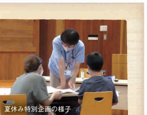
夏休み特別企画の様子

住所 和歌山県田辺市本宮町本宮100-1 FAX 0735-42-1560 TEL 0735-42-1044 E-mail e0624002@pref.wakayama.lg.jp