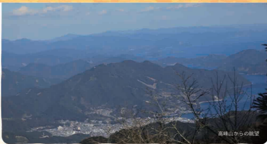
高峰山からの眺望

い。標高800mを越えるようになると、スギの巨木が何本か自生している。通常は水分環境の良い所に生えるスギだが、この辺りの稜線は海から吹き上がる水分の多い水蒸気が飽和になる高度であるため、一年を通して湿度が高く、尾根上でも生育できる環境であるといえる。急峻なガレ場や岩が交る細い尾根が現れ、通過に時間を要するようになると、いよいよトレイルの最高峰標高1,045mの高峰山に着く。尾鷲の街並み、そして遠く志摩半島方面、反対側は台高山脈や大峰山脈の山々が一望できる。尾鷲トレイル随一の眺望だ。