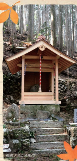
修復された不動堂

池原の筏師たちは、5つの筏組に組織されていたということから、最盛時には村に150人程の筏師がいたということになる。池原の筏師は、ふつう上北山の河合まで出かけ、池原を経て七色まで筏を運ぶ。七色からは、紀州の大沼の筏師が新宮まで流す。大沼には10組の筏組があったというから、300人程の筏師がいた。河合から池原まで流すのを上ユキ、池原から七色までは下ユキと言ったが、どちらも一日仕事。現在の和歌山県北山村の七色は、北山川の筏流しにとって重要な中継地であった。下ユキで七色まで筏を届けると、池原の筏師たちは竿と櫂をかついで市老谷を上がり、坂を越えて不動峠(606メートル)で一服した。不動峠には一間四方の不動堂と茶店が一軒あり、茶店では老婆が酒や駄菓子を買っていた。我が敬愛する山の旅人 田部重治(1884-1972)も昭和17(1942)年の晩秋のある日、この峠を越えている。