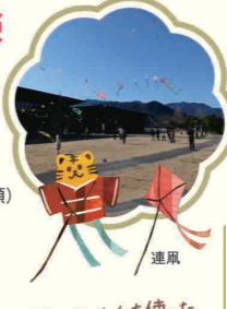
竹ひごカラーフィルムを使った10連の連凧を制作し、芝生広場で揚げます。

2022/1/2(日) 時間 ①午前10時～正午 ②午後1時～3時 参加料 200円 定員 各回10名(要申込・先着順) 場所 体験学習室 講師 熊野古道センター職員 受付 12月26日(日) 午後5時まで