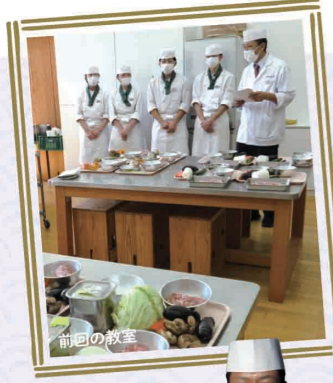
東紀州の四季を味わう料理教室