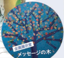
企画展示室 メッセージの木