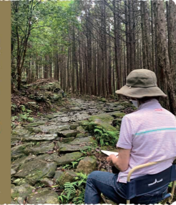
スケッチ教室の様子

2022/1/29(土) ~ 2022/3/27(日) ●会期中無休 時間 午前10時～午後5時 入場料 無料 場所 特別展示室