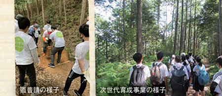
道普請の様子 次世代育成事業の様子

お問合せ先 和歌山県世界遺産センター 住所 和歌山県田辺市本宮町本宮100-1 TEL 0735-42-1044 FAX 0735-42-1560 E-mail e0624002@pref.wakayama.lg.jp