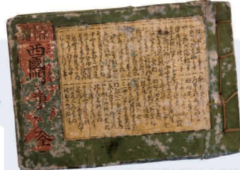
西国順礼道中細見大全・表紙

熊野古道伊勢路は江戸時代、西国三十三所観音霊場を巡礼する巡礼者が、伊勢神宮を参拝した後、第一番札所青岸渡寺を目指し歩いた道です。本展では当センター所蔵の西国巡礼に関する道中記などの史料を展示し、西国巡礼と伊勢路について紹介します。